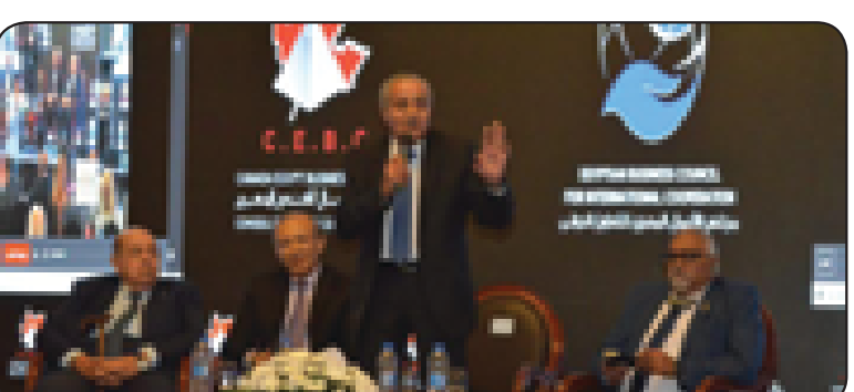
وزير التموين: الرئيس السيسي يعتمد خطة نشر أسواق الجملة ونصف المحافظات بالمحافظات خلال أيام