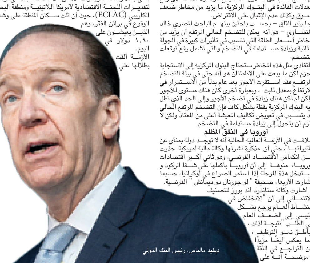
ديفيد مالباش، رئيس البنك الدولي

التراجع، فإن بنك الاحتياطي الفيدرالي الأمريكي سوف يعارض أي تخفيف سابق لأوانه للأوضاع المالية. وبالنسبة لمعظم البنوك المركزية الرئيسية الأخرى، فما تزال المخاطر المتصاعدة للتضخم قائمة، وبالتالي فإن الحفاظ على السياسة النقدية مشددة نسبياً سيكون أمراً ضرورياً بالنسبة لمصادقة أهداف سياستهم، وبشكل عام يواجه الاقتصاد العالمي مخاطر مستمرة بسبب الأزمة الروسية الأوكرانية، وفيروس كورونا، فضلاً عن استمرار خطر حدوث المزيد من صدمات الطاقة.