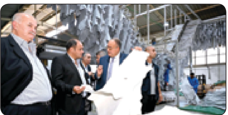
طرح 100 مصنع للمنتجات النهائية أمام المستثمرين قريبا.. وزير الصناعة: 7,2 مليار جنيهها استثمارا بمدينة الروبيكي للجلود

مراجعة وتقييم عدد من التشريعات الخاصة بالصناعة منها قانون تفصيل المنتج المحلي وتعديلاته، وقانون التنمية الصناعية، إضافة إلى تطوير دور الهيئات والجهات التابعة للوزارة للقيام بالأور النشطة بما يسهم في خدمة الصناع العربي والصناعي. متابعا: "الحكومة بكل أجهزتها تسعى جاهدة لإيجاد حلول عاجلة لتوفير المواد الخام ومستلزمات الإنتاج للقطاعات الصناعية، لضمان استمرار دوران عملة الإنتاج" مؤكدا حرص الوزارة على التنسيق المستمر مع كل الأجهزة المعنية للتعامل الفوري مع التحديات. وفي رده على تساؤلات أعضاء مجلس إدارة الاتحاد بشأن المعوقات الخاصة بإصدار التراخيص، أكد "سبير" أنه وكه هيئة التنمية الصناعية بالالتزام بتطبيق قانون التراخيص الصناعية وتنفيذ توجيهات رئيس الوزراء بمنح التراخيص خلال ٧ أيام للترخيص والإخطار، و٢٠ يوم عمل، وأنه يتابع تنفيذ تلك الخدمات حاليا ميكنة كل الخدمات التي تقدمها هيئة التنمية الصناعية والمستثمرين، وتفعيل منظومة الأركزية بآلية حالات تعدى المدد الزمنية المحددة لاتخاذ إجراء حاسم بشأنها.